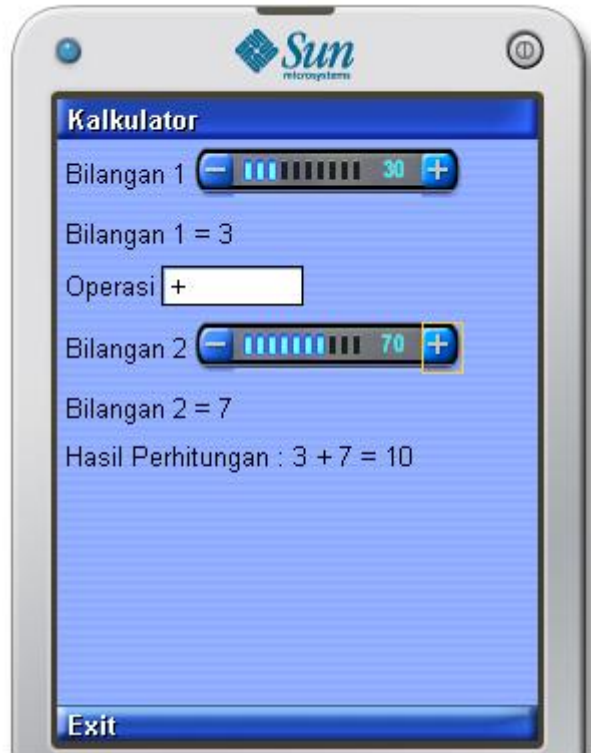
Gambar 2 Kalkulator

Setiap terjadi perubahan pada Bilangan1 / Bilangan2 / Operator, hasil perhitungan otomatis diupdate.