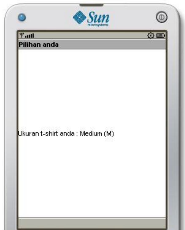
Gambar 1 Setelah dipilih